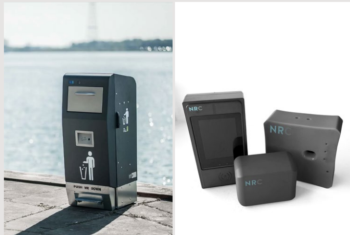
Namdal Ressurs satser på digitalisering og smarte, innovative løsninger.

Namdal Ressurs ble etablert i 1991 og feiret i fjor 30 år. Siden oppstarten har de levert utstyr og annet forbruksmateriell til avfallsbransjen i Norge, og består av 30 ansatte, inkludert datterbedriftene Fieldata, Namdal AB og Eco Service AS.